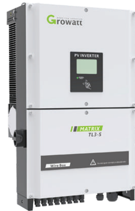
Inverter GROWATT 40000TL3-NS