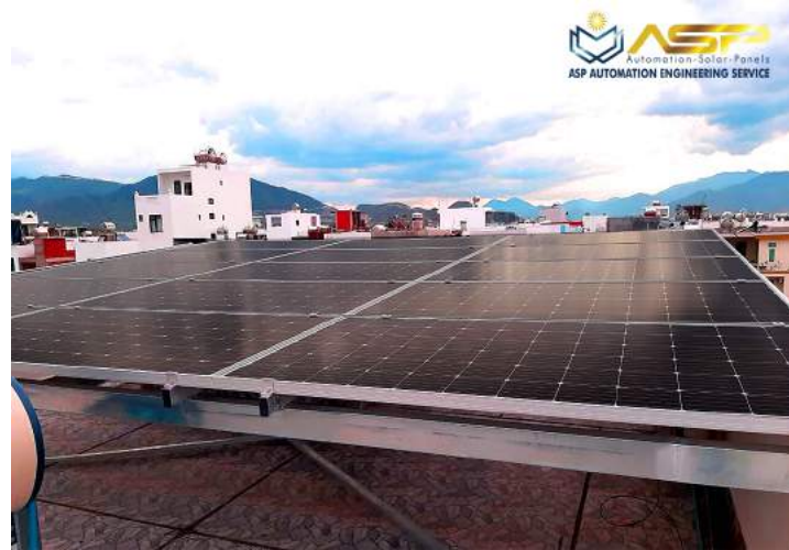
Solar Lắp Mái Bê-tông