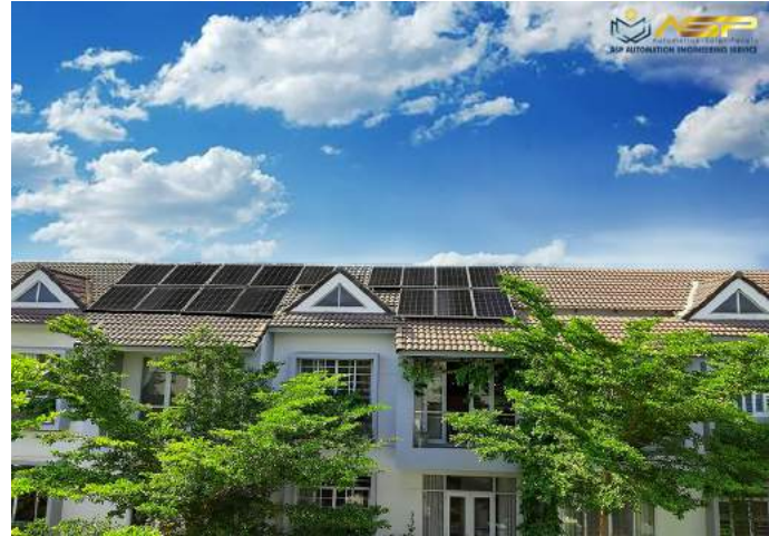
Solar Lắp Mái Ngói