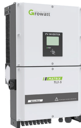
Inverter GROWATT 20000TL3- S