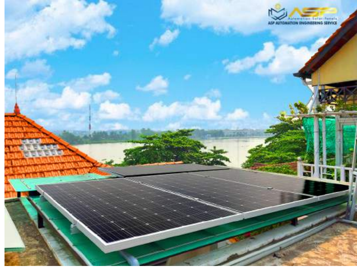
Solar Lắp Mái Tole