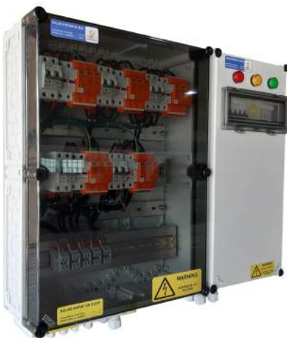
Tủ Điện ASP