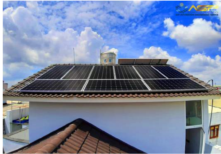
Solar Lắp Mái Ngói