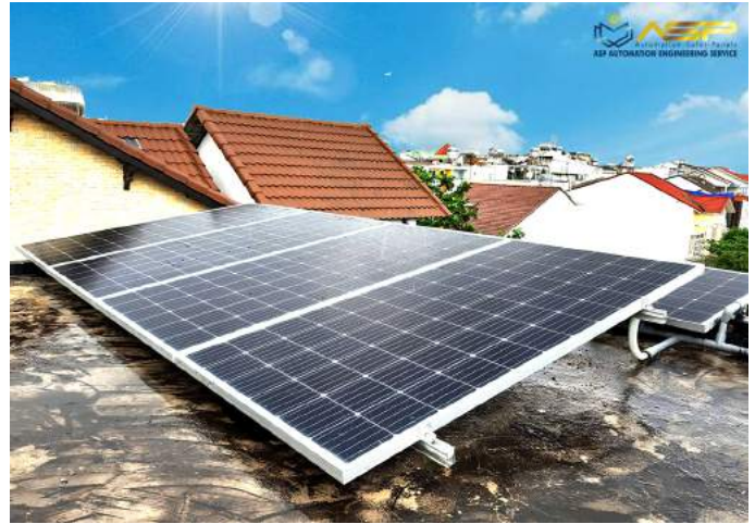
Solar Lắp Mái Bê-tông