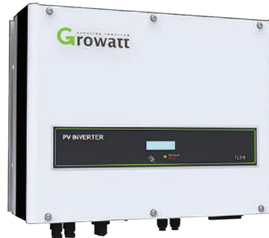
Inverter GROWATT 10000TL3- S