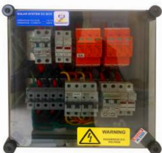
Tủ Điện ASP