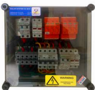
Tủ Điện ASP