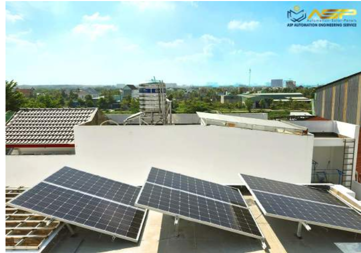
Solar Lắp Mái Bê-tông