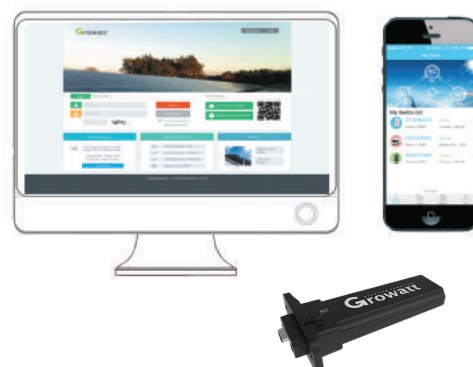
Giám sát SL điện Monitoring Shine WIFI-S