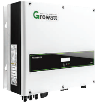
Inverter GROWATT 15000TL3- S