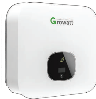
Inverter GROWATT 3000TL-XH