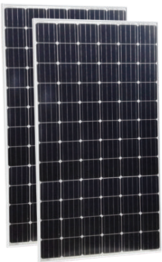
Tấm Pin PV Eagle PERC 72M-V 370