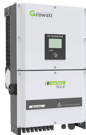
Inverter GROWATT 30000TL3- S