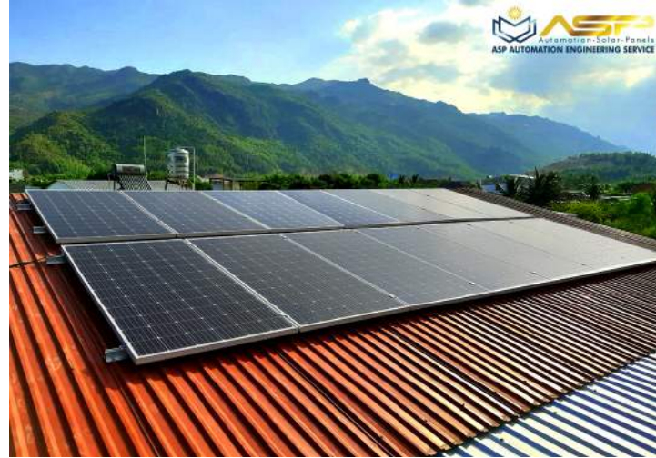
Solar Lắp Mái Tole