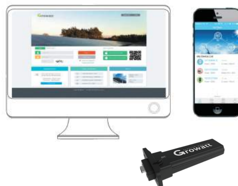
Giám sát SL điện Monitoring Shine WIFI-S